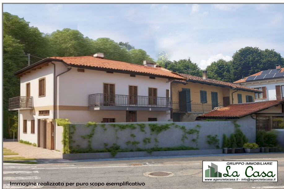
Immagine realizzata per puro scopo esemplificativo